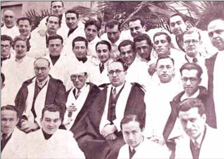
Resim 3. Liepmann (ortada başında beyaz beresi bulunan). Yanında Türk jinekoloji tarihinin unutulmaz isimleri olmayı başaran meslektaşları Naşid Erez (solunda) ve Tevfik Remzi Kazancıgil (sağında), asistanlar ve öğrencilerinden bir grup.

Derslerinde ilk vak'ayı anestezi altında sunmayı yeğleyerek, böylelikle öğrencilerinin hastadan alınacak anamnezin tesiri altında kalmadan, hastaya ağrı vermek ve onu utandırmak gibi endişelere kapılmadan muayene yapmalarını sağlar ve hemen şu vurguda bulunurdu: