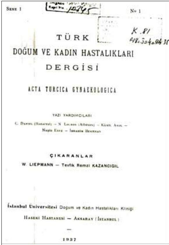
Resim 7. Liepmann'ın 1937 yılında yayınlamaya başladıkları, sürekliliği ilk sayısı ile sınırlı kalan Türk Doğum ve Kadın Hastalıkları Dergisi.

Liepmann, kısırlığın jinekolojinin en güç ama en önemli görevlerinden biri olduğunu da vurgular. Üreme sağlığı açısından Almanya ile Türkiye'yi şu değerlendirme ile kıyaslar: " Almanya'da 1933'de yapılan bir nüfus sa-