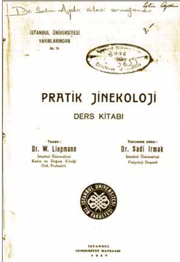
Resim 5. Liepmann'ın Sadi Irmak tarafından Türkçeye çevirilen Pratik Jinekoloji adlı kitabının iç kapađı.

Liepmann'ın dönemi, radyoterapi endikasyonunun oldukça geniş tutulduđu, pruritus vulvae'da bile radyoterapi tavsiye edilebilen, gebeliđin altıncı ayından sonra Röntgen ışınlarının gebeye zarar vermeyeceđinin savunulabildiđi, 18 colluma lokal radyum uygulamalarında bulunulan 19 bir dönemdi. Röntgen tedavisi ve radyum ile tedavi yaklaőtımının lehinde ve aleyhinde (özellikle cerrahlar) bulunanların harareti tartıőmaları ise sürüyordu. Liepmann, derslerinde öğrencilerini radyoterapinin toplum kaynaklarının kullanımı açısından pahalı bir tedavi