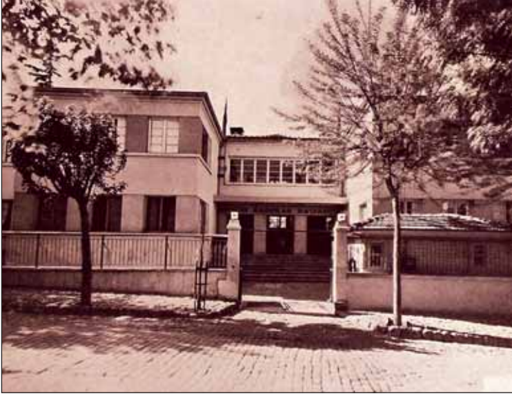
Resim 2. Zamanın Haseki Hastanesi Kadın Hastalıkları ve Doğum Kliniği.