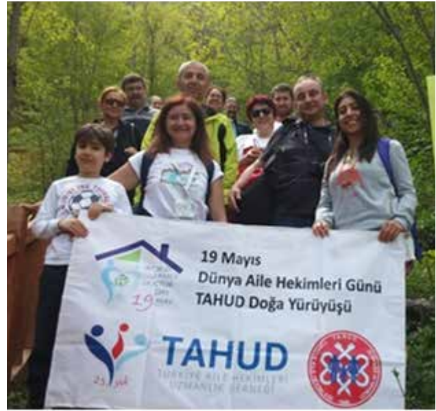
Resim 2. İnaltı Mağarasına giriş