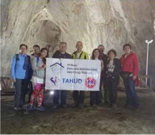
Resim 4. İnaltı mağarasından çıkış

DOGAY yukarıda tanımlanan ilke ile düzenlenen, Türkiye Fotoğraf Sanatı Federasyonu tarafından desteklenen ülkemizdeki en özgün ve kapsamlı fotoğraf yarışmasıdır. Bir fotoğraf yarışmasının tüm aşamalarının aynı yerde, 72 saat içinde gerçekleştirildiği DOĞAY, 1995'ten bu yana her yıl Türkiye'nin farklı bir yöresinde düzenlenmektedir. Her yarışmacı aynı ortamda, aynı iklim ve ışık koşullarında, aynı zaman diliminde fotoğraf çekerek yarışır. Çekimlerin bitmesinden sonra seçici kurul toplanır, fotoğrafları değerlendirir ve yöre halkının katılımı ile ödül töreni yapılır. Dünyada da eşi ol-