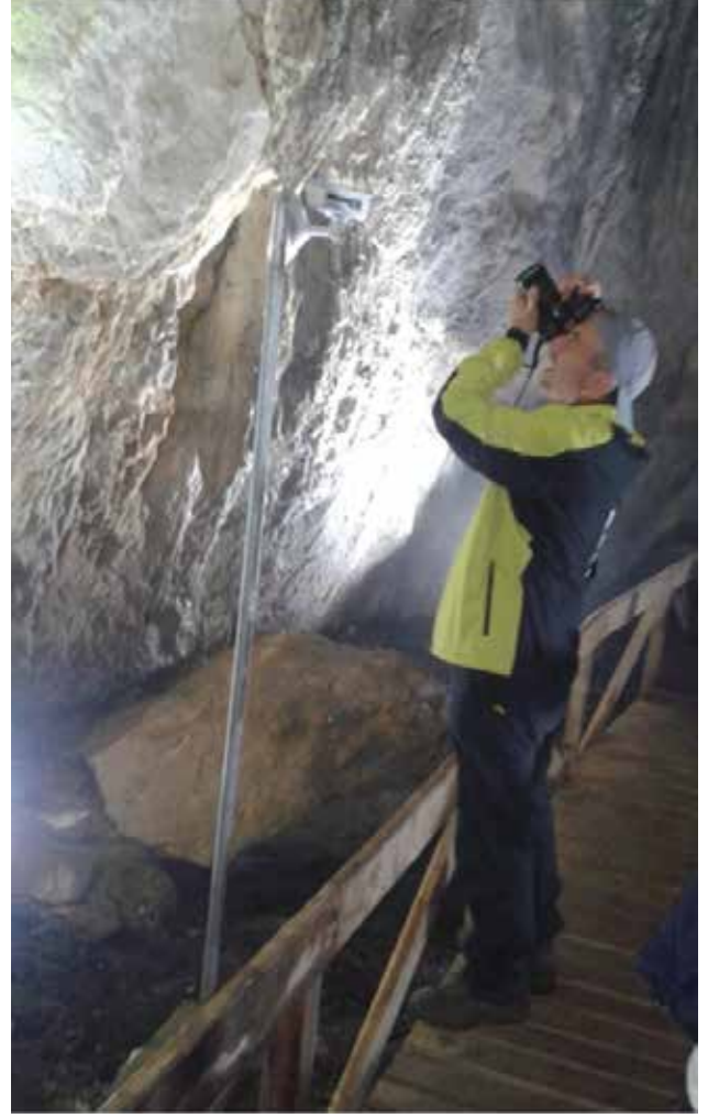
Resim 4. İnaltı Mağarasında görüntü avcılığı