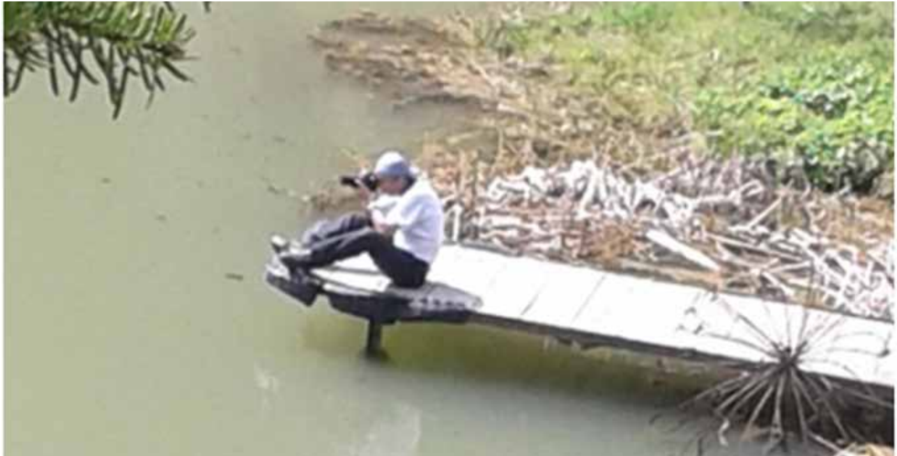
Resim 3. Akgöl'de yürüyüş sırasında görüntü avcılığı

Ne yazık ki yarışmaya az sayıda aile hekimi katıldı. Sergileme veya ödül kazanan olmadı, ancak aile hekimlerinin en iyi 20 karesi İstanbul'da düzenlenecek olan WONCA 2015 Avrupa Kongresinde sergilenecek. İlginç bir rastlantı sonucu, Makro Doğa kategorisinde verilmesi kararlaştırılan