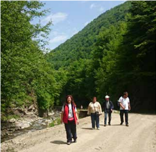
Resim 1. İnaltı Kanyonuna doğru yürüyüş