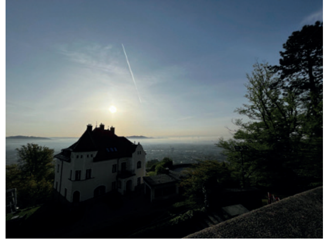
Resim 3. Pöstlingberg'den Linz şehri manzarası

8. EYFDM FORUM Vienna öncesi Linz'deki Değişim Programı'ndaki deneyimim, Avusturya birinci basamak sağlık sistemi ve tamamlayıcı tıbbın modern tıba destek olma potansiyeli hakkında paha biçilmez bilgiler sağladı. Klinik gözlemlerimin yanı sıra Linz'in estetik mimariye sahip yapıları, Tuna nehri ve doğayla iç içe Pöstlingberg tepesinden muhteşem şehir manzarası ruhuma çok iyi geldi (Resim 3).